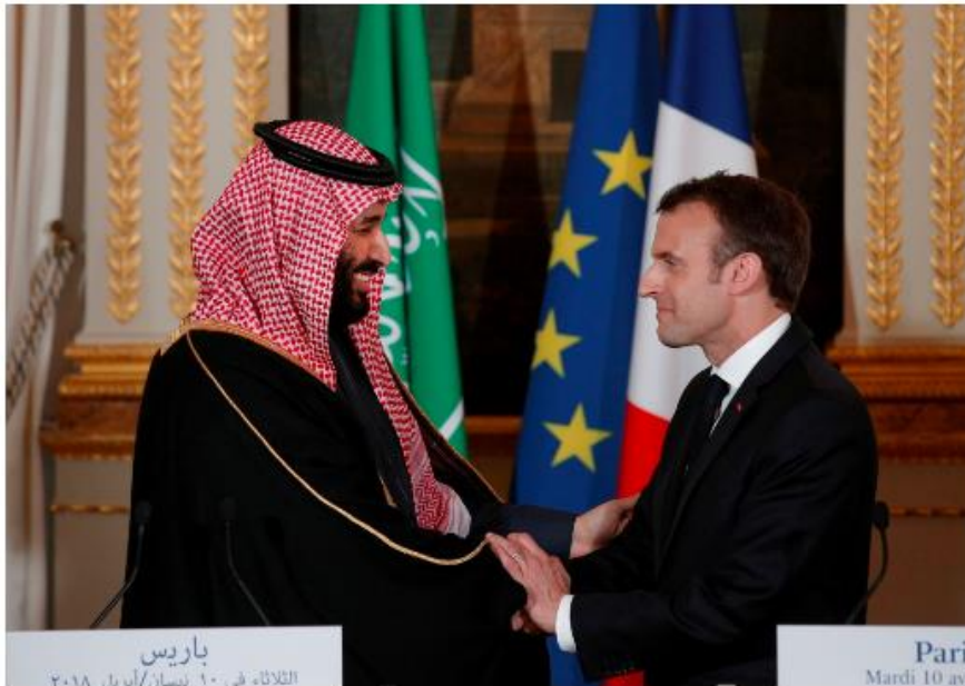
French President Emmanuel Macron and Saudi Arabia's Crown Prince Mohammed bin Salman shake hands.

AFP Agence France-Presse Published: 8:18pm, 8 May 2019